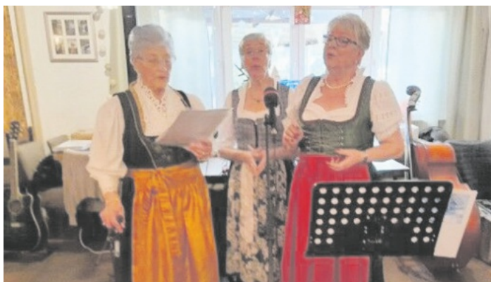
Die singenden Hausfrauen

Weitere Impressionen vom weihnachtlichen Seniorennachmittag