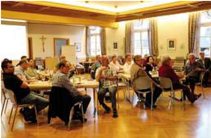
Vorstellung der Vorgehensweise