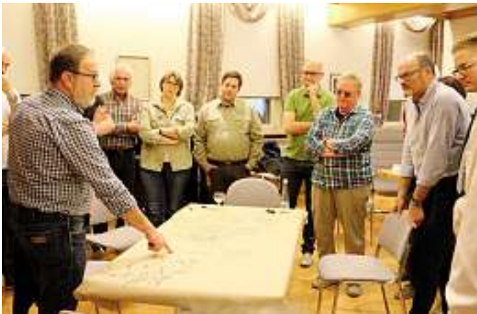
Besprechung der Ergebnisse