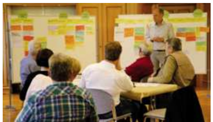
Sortierung und Clusterung der Themen