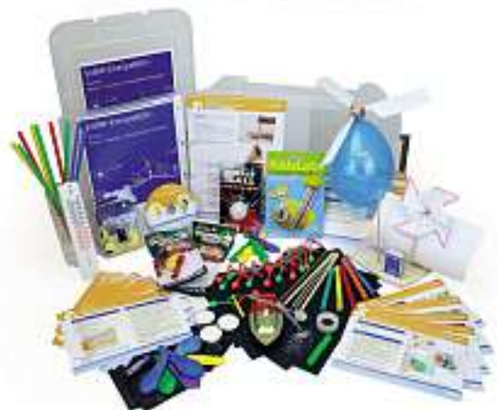
Inhalt der EnergieBOX